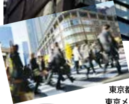
原一探偵事務所 日本橋支社